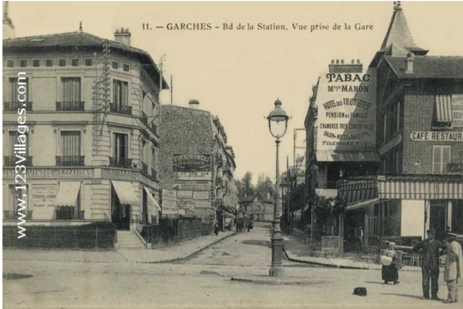
Photo Année 2000